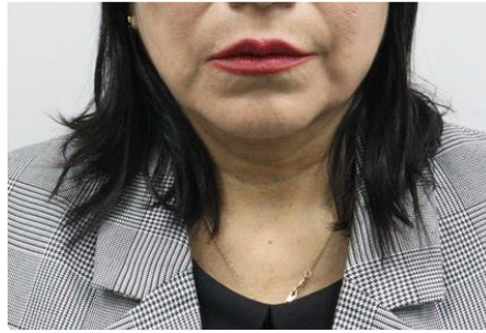
LYDIA LOURDES DIAZ PABLO SEGUNDO VICEPRESIDENTE DE LA REPÚBLICA